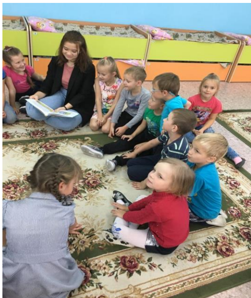
Фотозона " Чтение под абажуром"

Странички для младшего братика или сестрички» Литературные минутки. (Дети школьного возраста читают дошкольникам произведения со страниц детских книг)